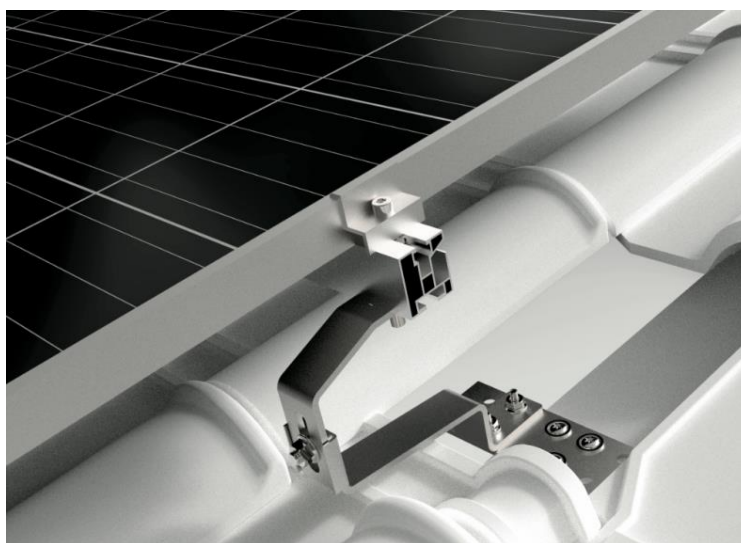
Instalace FVE na taškovou střechu pomocí střešních háků

Konstrukce bude řešena pomocí hliníkových profilů, které budou kotveny do střechy pomocí střešních háků. Střešní krytina je pálena taška.